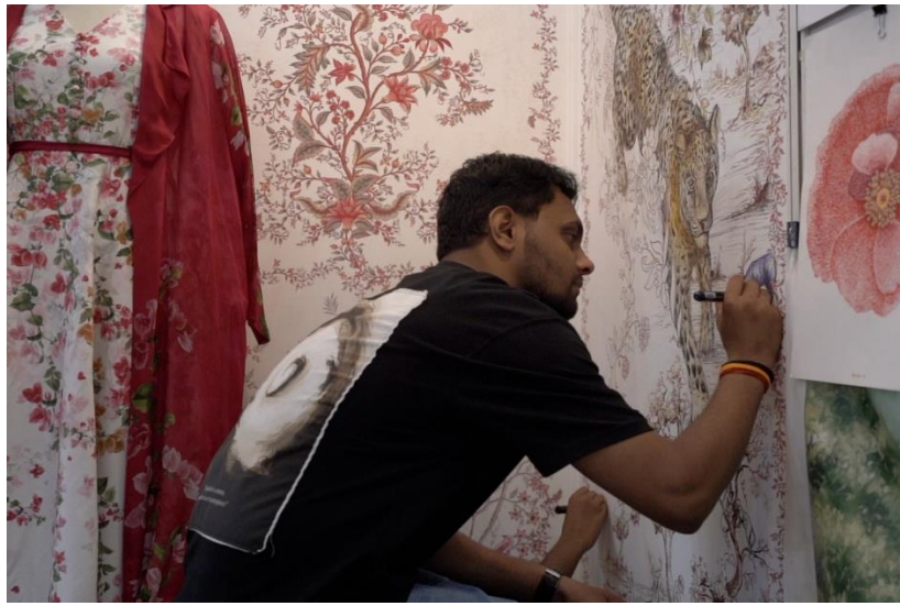
Photo 6: Live craft demonstration by craftperson during 19 th IFJAS'25 at IEML, Greater Noida